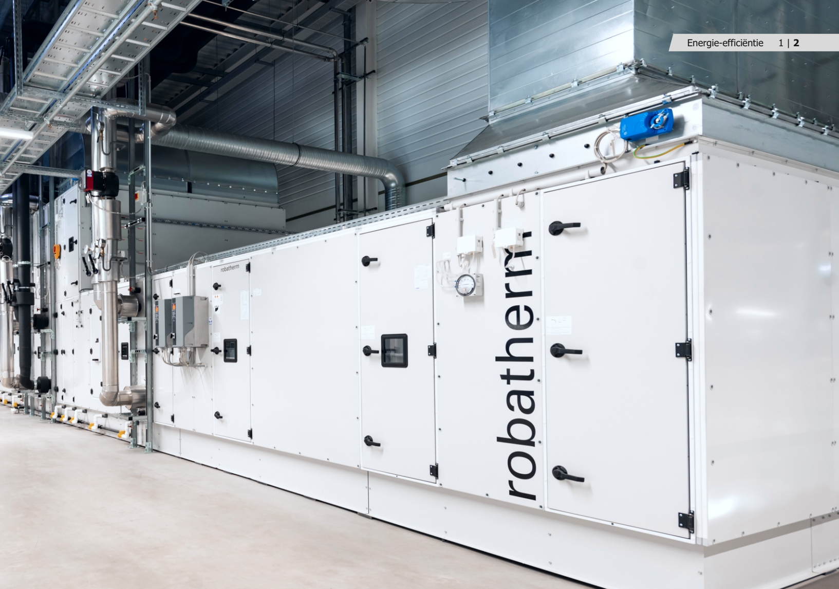
robatherm luchtbehandelingskasten met EUROVENT energie-efficiëntieklasse A+.